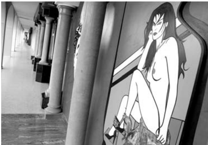
Am Vormittag sind die Bordelleingänge noch verwaist.