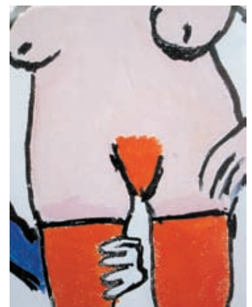
Werbung für die Ware Frau.

der Menschenhändler. „Schlepperbanden finden die Mädchen meistens auf dem Land“, sagt der ehemalige Insider Maier. Mit Versprechen, dass man ihnen in Spanien einen Job als Kellnerin oder Putz-