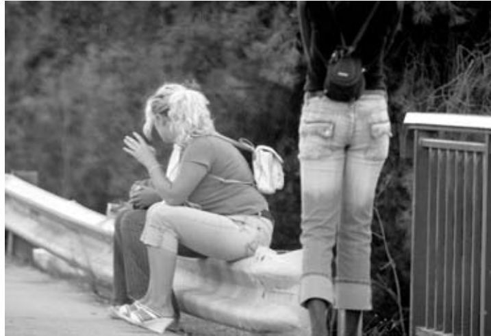
Warten auf Freier.

Denn die Geschichte der Prostitution in Spanien verlief wechselvoll. Ende des 18. Jahrhunderts wurde das Gewerbe in Spanien staatlich reglementiert und bis 1956 sogar öffentlich toleriert. Erst dann verbot der Franquismus das Geschäft mit der käuflichen Liebe. Die Konsequenz: Spaniens Männer zogen über die Grenzen bis nach Frankreich, um Pornofilme zu sehen oder Sex zu kaufen. Seit