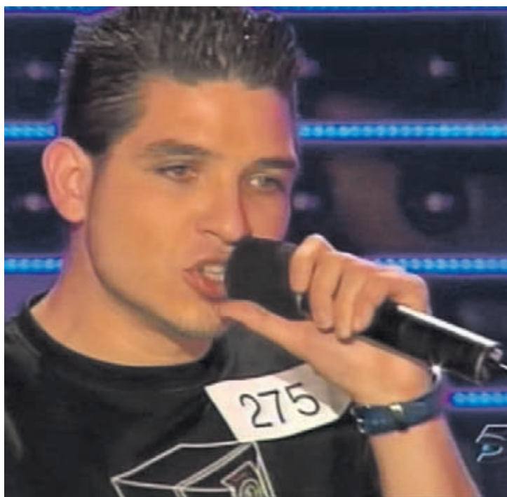
„Xikano“ bei einem Fernsehauftritt.